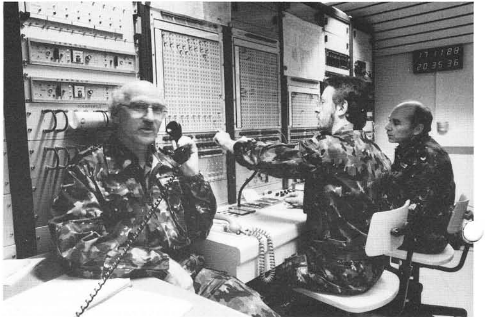
Irgendwann «zwischen Abend und Morgen» wirken, beispielsweise im Schaltraum, auch Spezialisten aus dem Hause Studer. – Wer kann diese erkennen?

Das Radiostudio untersteht der «Abteilung Presse und Funkspruch» (APF) des Eidgenössischen Justiz- und Polizeidepartementes und hat die Aufgabe, in Krisenzeiten – sollten die normalen Rundfunkstudios nicht mehr arbeitsfähig sein – die Versorgung der Schweiz mit Radioinformationen sicherzustellen. Dafür ist eine vollständige Infrastruktur entwickelt, aufgebaut und über die letzten Jahrzehnte laufend den neuesten Erkenntnissen angepasst worden. Grundsätzlich wird dabei zwischen mobilen und stationären Systemen unterschieden, wobei zu den letzteren auch verschiedene Sendeanlagen für UKW-, Mittel- und Kurzwellausstrahlung zählen.