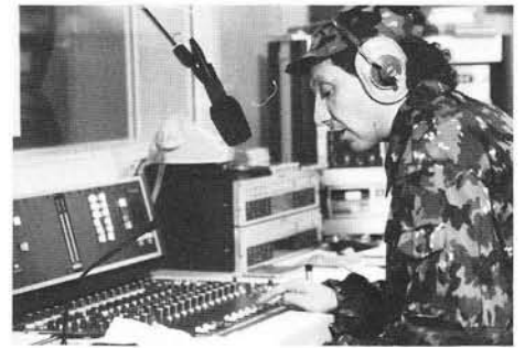
Die Moderation und Ansage von Sendungen erfolgt grundsätzlich durch bekannte Stimme. Im Bild ein beliebter Schweizer Radioreporter und TV-Quizmaster im «Disk-Jockey»-Einsatz am Studer 962.

Bei den «Stationären» liegt das Hauptgewicht auf der Forderung, das zivile Produktions- und Sendernetz ersatzweise übernehmen zu können. In einem ausgesprochen föderalistischen Land, wo Programme in vier Sprachen gesendet werden (ohne Auslandsdienste), stellt das hohe Anforderungen an die Truppe, die sich vor allem aus Spezialisten der SRG (Schweizerische Radio- und Fernsehgesellschaft) und den entsprechenden Industriebereichen rekrutiert.