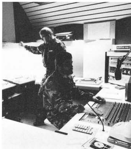
Angehörige der Armee, in Zivil Fachspezialisten, an der Arbeit in einer der Produktions- und Senderegien.

Sie vermuten richtig, es handelt sich um ein militärisches Objekt in ... – in der Schweiz. Dass ich mich über den Standort nicht weiter äussere, hat seine Gründe: Das geheime Objekt befindet sich nämlich nicht in einer Kaserne, auch nicht in einer Militärhochschule und schon gar nicht in einer fliegenden Festung, denn diese gibt es in der defensiven Schweiz eben nicht. Hingegen stimmt Festung. Eine, die man nicht abschiessen kann. Denn erstens ist sie in sehr harten Fels gehauen und zweitens unsichtbar versteckt (getarnt). Und versuchen Sie nicht, diese auf eigene Faust zu finden, denn die Schweiz verfügt, obwohl sehr klein, über jede nur erdenkliche Menge harten Fels für nichtzivile Bauten!