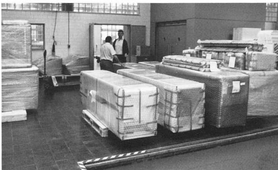
Am 6. Juni war es soweit: Die erste Teillieferung des Grossprojektes Radio Luxembourg wird in Regensdorf verladen.